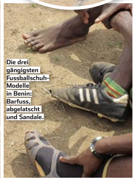
Die drei gängigsten Fussballschuh-Modelle in Benin: Barfuss, abgelatscht und Sandale.